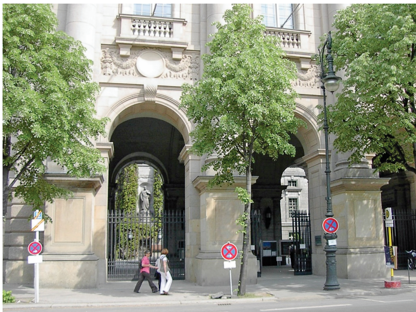
Εικ. 1. Είσοδος τής Κρατικής βιβλιοθήκης Βερολίνου.