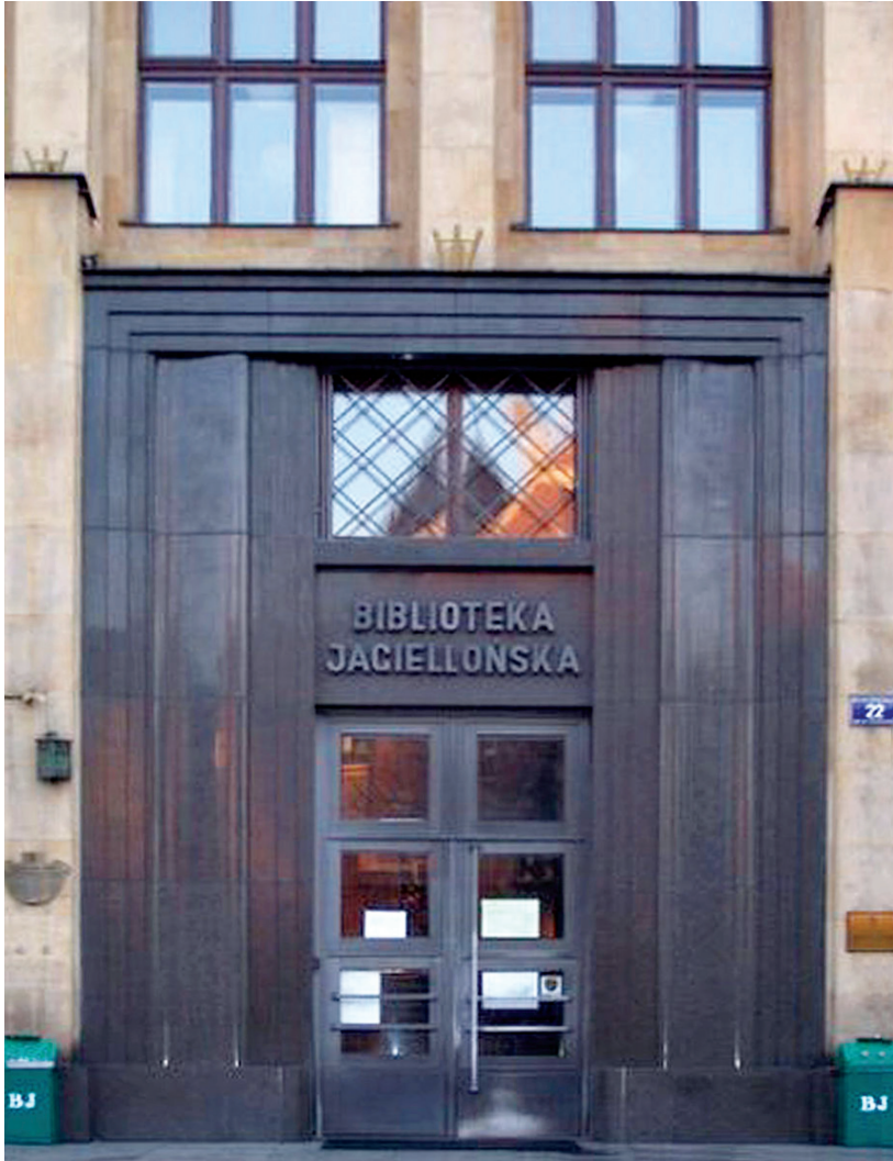
Εἰκ. 2. Εἴσοδος τῆς Πανεπιστημιακῆς βιβλιοθήκης Jagiellońska στὴν Κρακοβία (φωτ. ἀπὸ τὸ διαδίκτυο).