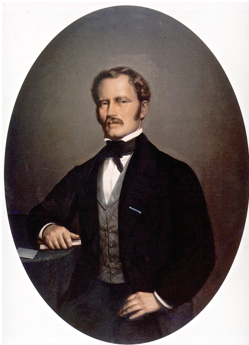
Είχ. 3. Ludwig Ross, γερμανός αρχαιολόγος (1806-1859).